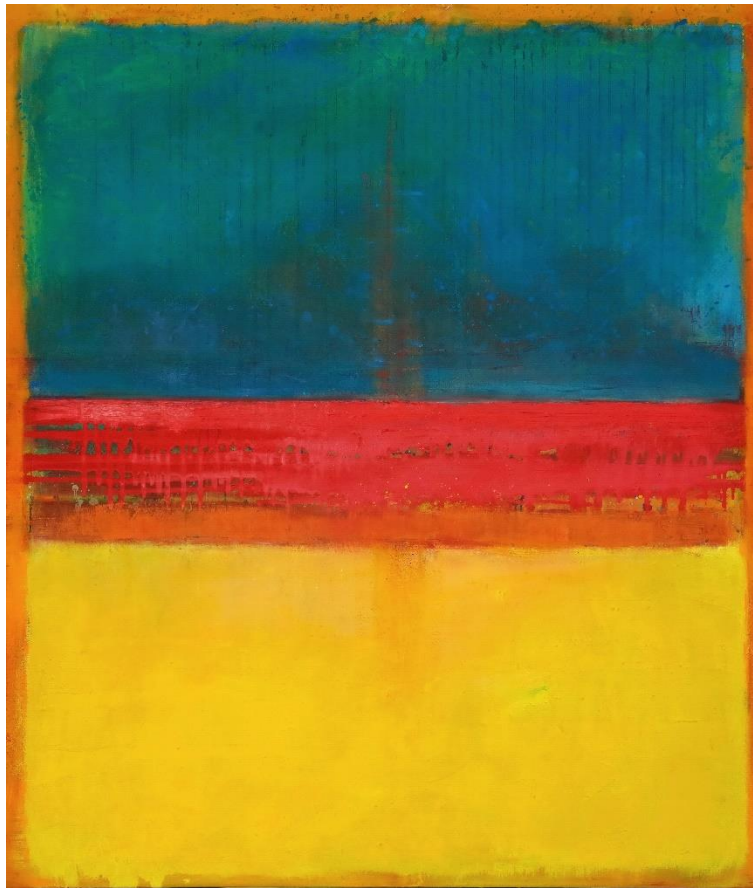
Guido Lötscher: Red flow Mischtechnik auf Leinwand, 140 x 120 x 2 cm, 2019