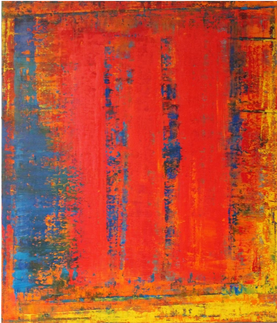
Guido Lötscher: flames

In Zürich zeigt sich Lötscher variantenreich und zeigt neben einem klassischen Öl-Farbfeldgemälde schergewichtig Arbeiten, die in Mischtechnik mit pigmentierten Eisendispersionen, Oxydationsmedium, Kreide- und Ölfarben aufgebaut sind.